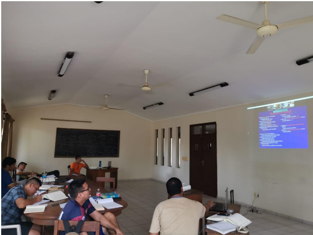
Clase virtual en el Seminario con Primero de Teología