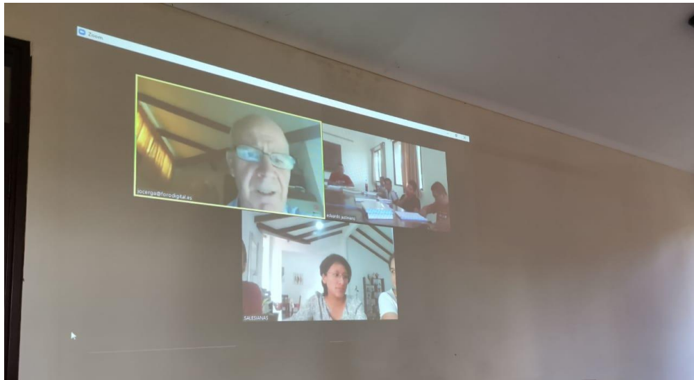
En clase de Evangelios Sinópticos con las hermanas Salesianas